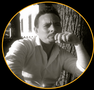
Psicologo e Psicoterapeuta